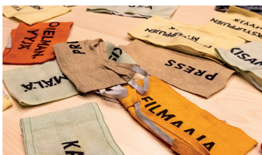
Käsivarsinauhoja löytyi joka lähtöön.