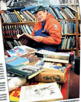
Loimaan hiihtohistoriallinen seminaari kokoaa yhteen urheilutietämystä. Seminaari on osa Loimaan hiihtohistoriallisen seminaarin järjestelytoimikunnan toimintaa.

Loimaan hiihtohistoriallinen seminaari kokoaa yhteen urheilutietämystä. Seminaari on osa Loimaan hiihtohistoriallisen seminaarin järjestelytoimikunnan toimintaa. Seminaari on osa Loimaan hiihtohistoriallisen seminaarin järjestelytoimikunnan toimintaa. Seminaari on osa Loimaan hiihtohistoriallisen seminaarin järjestelytoimikunnan toimintaa.