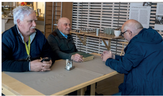
Kuulumiset vaihtuivat hiihtomiesten kahvitauolla.