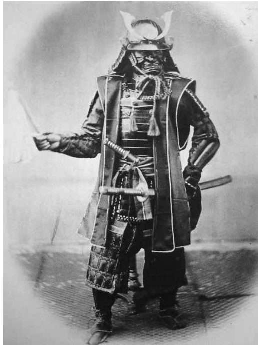
Taistelukentille suunnitellut samuraiden varhaiset taidot perustuivat aseiden käyttöön, yleensä haarniskoituna. Kuvassa vanhaan samuraihaarniskaan puukeutunut soturi 1860-luvulta.

suaalisuus, jonka juuret juontuvat buddhalaisiin luostareihin. McLelandin mukaan feodaalijajan Japanissa aikuinen samuraimies saattoi tavallisen perhe-elämän lisäksi – tai sen sijasta – solmia homoeroottisen suhteen sellaisen samurai-luokkaan kuuluvan nuorukaisen kanssa, joka ei vielä ollut suorittanut aikuistumisseremoniaansa. Tapaa kutsuttiin nimellä nanshoku tai wakashudō , joka muodostui käsitteeksi ”nuorukaisten tie” tai ”nuorten miesten tie”, lyhyemmin shudō . Tätä pidettiin tärkeänä osana samuraiden tapakulttuuria, sitä sääтели tiukka etiketti ja se inspiroi myös useita taiteilijoita sekä kirjailijoita. Miesten välisiin eroottisiin suhteisiin ei liittynyt kummankaan osapuolen määrittelemistä naismaiseksi tai feminiiniseksi, joten molemmat saattoivat säilyttää maskuliinisuutensa ja miesidentiteettinsä. Tämä ajatusmalli sopi hyvin samuraiden maskuliiniseen ja sotilaalliseen elämäntapaan. Wakashudōn perinne kukoisti etenkin 1500–1700-luvuilla. Vastaavanlainen tapa on ollut varsin yleinen tai ainakin hyväksytty myös muiden soturikansojen keskuudessa esikristillisenä ja esi-islamalaisena aikana, kuten intiaaneilla, kelteillä, kiinalaisilla, viikingeillä sekä antiikin kreikkalaisilla ja roomalaisilla. 10