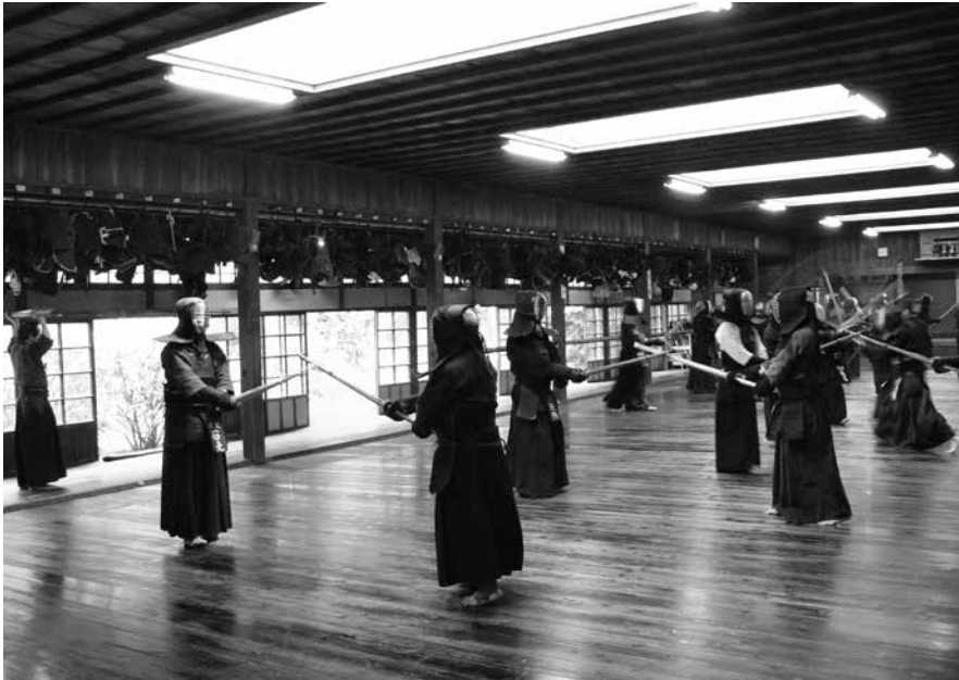
Edo-kaudella (1600–1868) alkoi kehittyä samuraiden siviilielämään ja kaksintais- teluihin soveltuvia kamppailujärjestelmiä. Vapaamuotoinen ottelu suojavarusteissa noui joissakin koulukunnissa tärkeäksi harjoitusmetodiksi, josta kehittyi myöhem- min moderni kendō. Ottelijoita Noma dōjolla vuonna 2007.

seen. Tällainen vaatetus salli taktisesti paljon enemmän mahdollisuuksia erilaisten iskujen ( atemi ) käyttöön. Siitä huolimatta aseettomat iskut oli- vat edelleen toissijaisia. Samurai oli nimittäin harvoin täysin aseettoma- na, edes sisätiloissa. Tästä johtuen kumiuchin keskeinen tavoite oli estää vastustajaa vetämästä asettaan ja toisaalta antaa itselle mahdollisuus ve- tää esille oma tai vastustajan ase. Tähän pyrittiin kontrolloimalla esi- merkiksi vastustajan käsiä, etenkin hänen asekkättään, vartalon liikettä, miekan kahvaa tai koteloa. Vastaavasti toinen osapuoli koetti käyttää vastatekniikoita, joiden avulla hän kykenisi vetämään aseensa. Molem- pia taktiikoita opetettiin tavallisesti jū-jutsu-koulukunnissa. Mutō-dori puolestaan tarkoitti vastustajan riisumista aseista tilanteessa, jossa hän oli jo saanut aseensa esille. 23