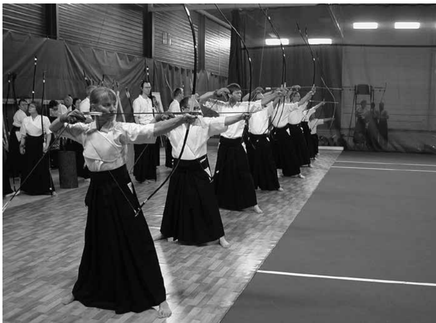
Moderni budō-ihanne rakennettiin toisen maailmansodan jälkeen. Taistelua painottavan harjoittelun tilalle tulivat toisaalta urheilulliset arvot, toisaalta pyrkimys kehittää ihmistä fyysisesti, henkisesti ja moraalisesti ei-kilpailullisessa ilmapiirissä. Kuvassa vapaaharjoittelua Suomen Kyudoliiton kesäleirillä 2007.

site, jolla viitataan joskus kaikkiin Aasiasta lähtöisin oleviin kamppailutaitoihin. Tunnetuin lienee korealainen taekwondo. Suomeen laji tuli varsinaisesti vuonna 1979 ja ensimmäinen kansallinen lajiliitto, Suomen Taekwondoliitto ry (1981), perustettiin hieman myöhemmin.