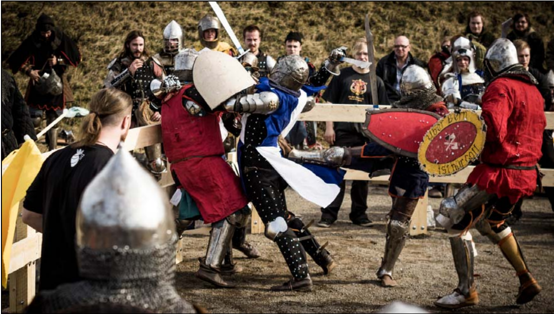
Buhurt eli keskiaikaa mallintava täyden kontaktin joukkuekampailulaji on vauhdikasta katsottavaa. Buhurt saapui Suomeen heinäkuussa 2013.