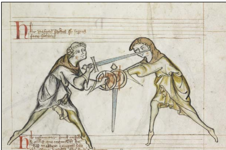
Tower Fechtbuch eli MS I.33 on tiettävästi vanhin eurooppalainen keskiajalta säilynyt kamppailuopas. Se on ajoitettu 1320-luvulle.

Ajallisesti monet pitävät HEMA:n lähtökohtana ensimmäisiä eurooppalaisia yksilökamppailua opettavia kirjoja. Satunnaisia kuvauksia esimerkiksi kreikkalaisesta painitekniikasta ja miekkailusta löytyy toki jo antiikin kirjallisuudesta kuten Oxyrhynchus Papyrus (MS P.Oxy.III.466), jonka sijoituspaikka on New Yorkissa Columbia University’n Rare Book & Manuscript Library. Tätä mahdollisesti jopa 100-luvulta peräisin olevaa papyrusta pidetään vanhimpana säilyneenä länsimaisena