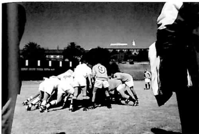
Eteläafrikkalaista rugbya Johannesburgissa.