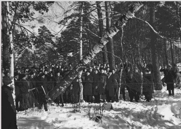
Helsingin stadionin rakennustyöt alkoivat 80 vuotta sitten.